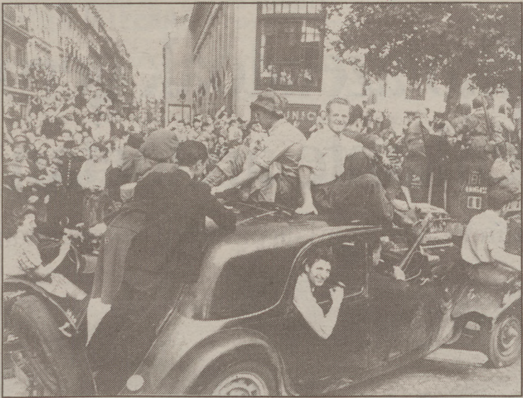
Capak Parisen 1944eko abuztuaren 26an egindako argazkia.