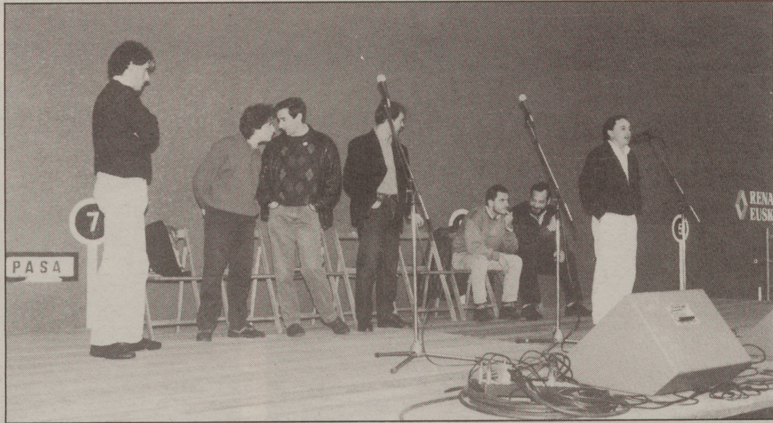
Gipuzkoako Txapelketako finalean kantatutako sei bertsolari aritu ziren Andoainen San Jose egunez. XOFOR

Olasok Sebastianen purua gogoratu zuen, errezor durako ez zela egokia esanez. Egañak intzentsuaren lekurako zela zioen. Peña txapeldunak, berriz,