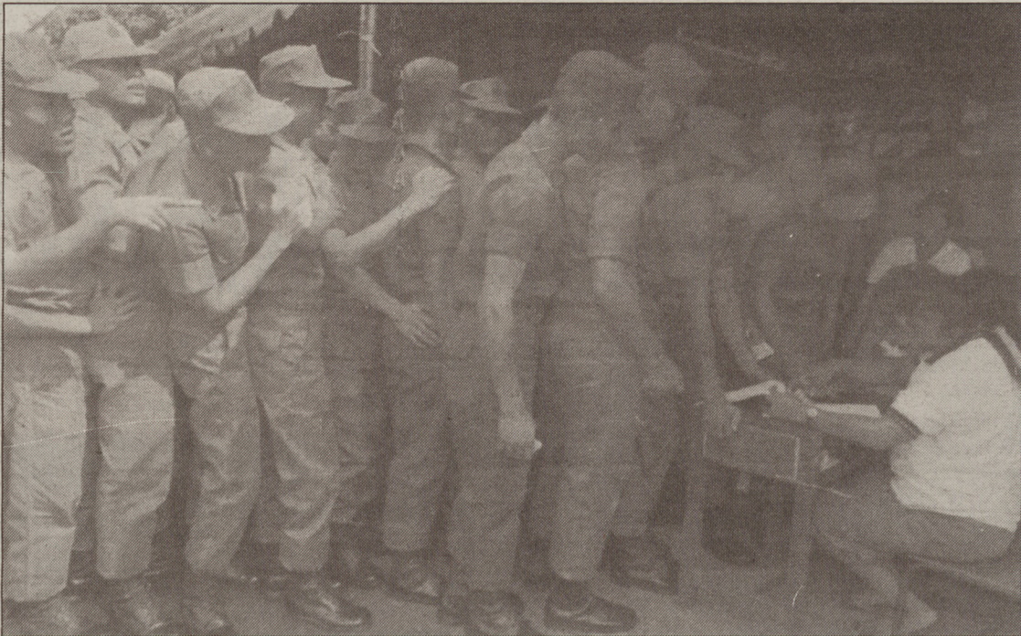
Militar thailandiarrek militarren aldeko alderdiei eman zieten botoa.

Egunkari britainiarraren arabera, Malvinetako herritarrek John Majorren administrazio kontserbadoreak boterean segi dezala nahi dute, Gobernu tori batek britainiarrak izaten jarraitzeko duten guraria errespetatuko duela eritzi bait diote. Beldur dira, ordea, Gobernu laborista bat Argentinarekin elkarrizketatzen hasiko den Malvinen etorkizuna eztabaidatzeko. Horregatik, Malvinetako britainiarrak gogor jarri dira eta adierazi dute beraiek kontutuan hartu gabe ez dietela laboristei negoziatzen utziko.