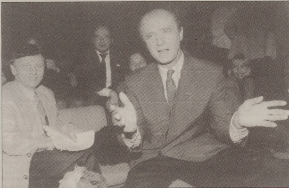
Biak garaile irten arren, Lalonde eta Waechterren arteko borrokan lehenak irabazi du.