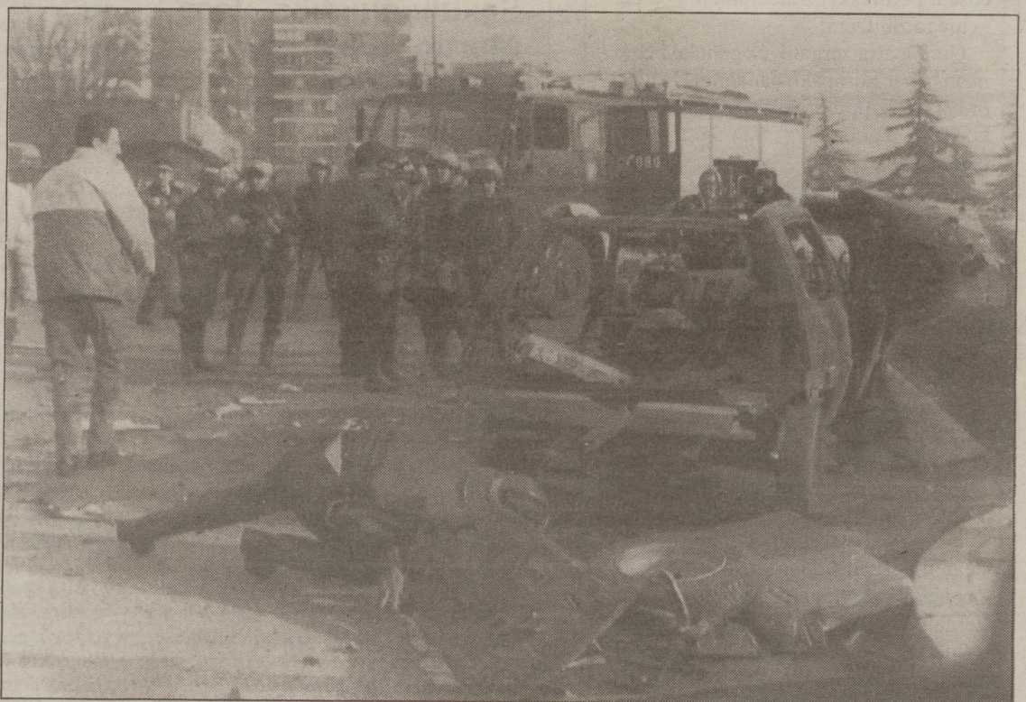
Citroen AX kotxea txikituta utzi zuen bere azpian jarritako lehergailuaren eztandak.

Tomas de la Quadra-Salcedo Espainiako Justizia ministroak, lehendik emandako mezuari eutsi zion atzoko atentuari buruz hitzegitean: «Ez da inoiz negoziatziorik egongo terroristekin, etengabeko borroka baizik», esan zuen ministroak. / 4