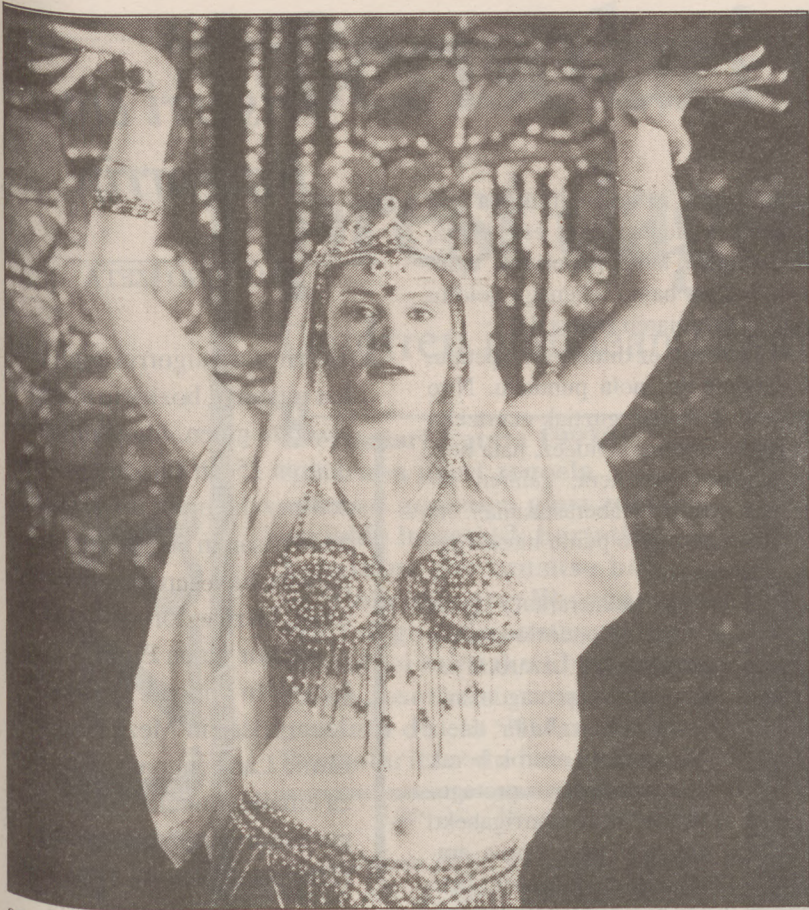
SESB zenaren hainbat kultur adierazpen agertuko ditu Nazarov konpainiak.