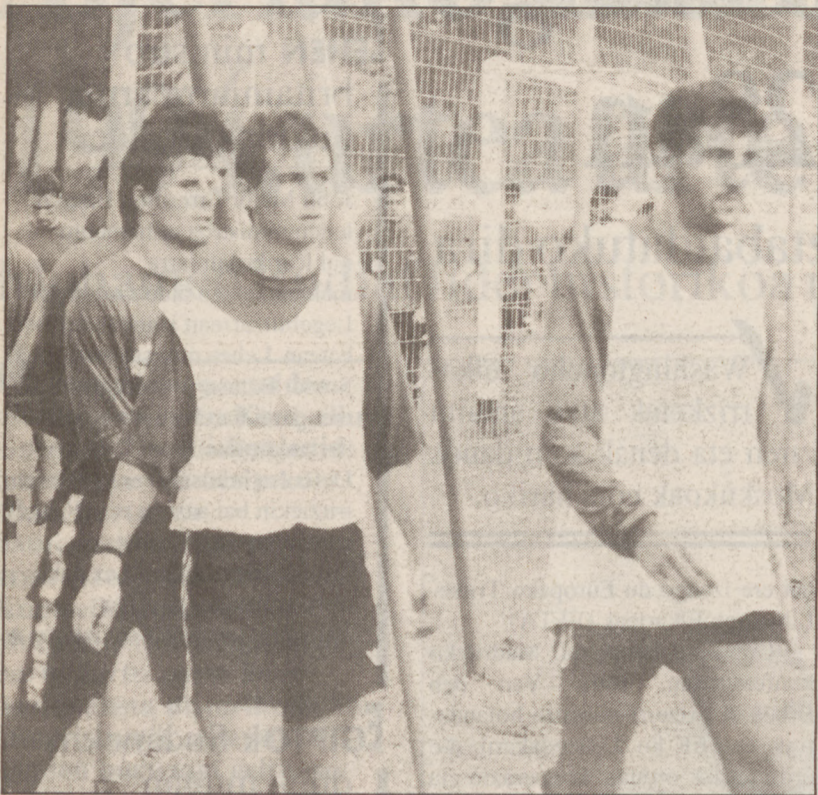
Saezek nahiko lan izango du igandean atzelaldea osatzeko. BASALDUA