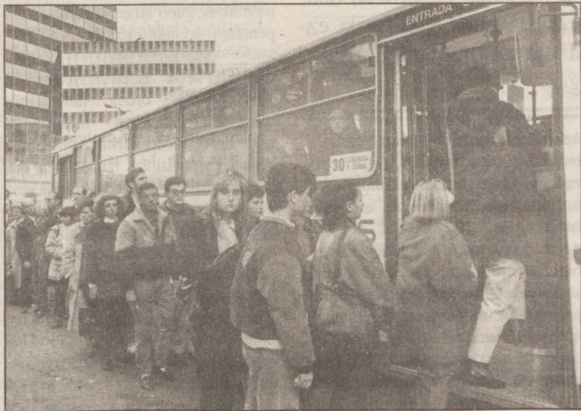
Garraioaren prezioak merketu egin ziren abenduan EAEn.