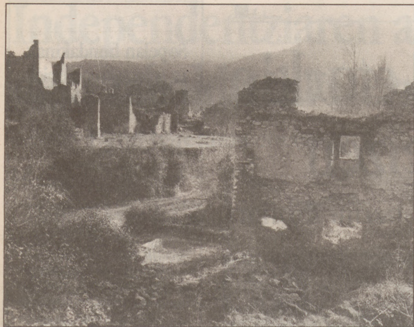
Euskaldunon aintzinako arbola sakratua gaixorik dago.