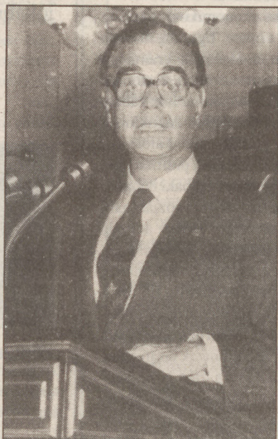
Manuel Broseta Pont.