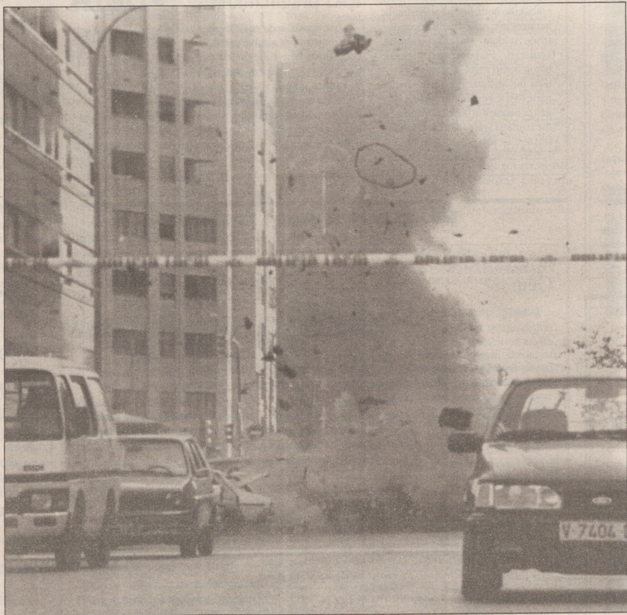
Atentatugileek erabilitako autoan utzitako bonbak polizia bat zauritu zuen TEDAXekoak miaztera zihoazenean.

Korac kopako final laurdenak jokatzeko moduan izango da Taugres atzo Kroaziako Zadar taldeari 79-72 irabazi ondoren. Aurretik Benettonek galdu egin zuen bere partidua eta klasifikatzeko irabaztea nahikoa zuen Taugresek. Lehen zatiaren amaieran hartu zuten hamar puntu inguruko aldearen barruko joko ikusgarriari esker, eta bigarren zatian abantailari eustea nahikoa izan zuten gasteiztarrek.