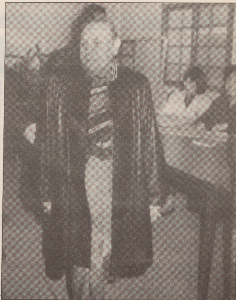
Chiang Ching Kuoren alargunak ere bere botoa eman zuen atzo.

rak, Alderdi Demokrata Progresistak hartu duena, duela urte gutxi gartzelako bidea hartzea suposatzen zuen. Baina Chiang Ching Kuo lehendakaria hil ostean, Taiwaneko 'perestroikak' ideologia desberdinak sartzeko aukera eman zuen. KMT alderdiak Txina osoa ordezkatzen duelako ideia ez du baztertu, nahiz eta ia inork ez dion jaramonik egiten. Alderdi Demokrata Progresistak berriz, Txinarekin harreman guztiak hautsi eta irlak bere bidea hartzea proposatzen du, kontinentetik at bere identitate propioarekin.