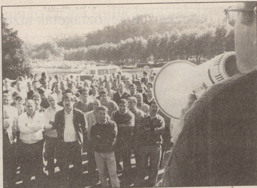
Acenorren egoera badirudi konponbidean degoela.

Sidenorren Bideragarritasun Plangintzaren arabera, Acenorrek