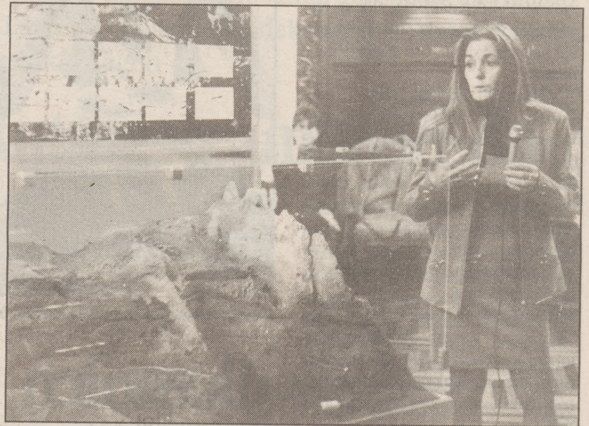
Maketa saritua erakutsi zuten atzo Diputazioan.

Hala ere, berba horiek ematen ziren artean, kalean, Foru Jauregiko