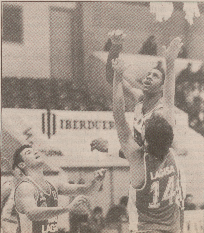
Askatuak ahludutako taldearen aurka irabazteko parada ona du.