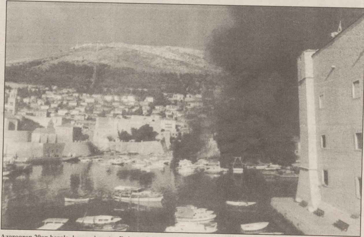
Azaroaren 20an bezala, kea zerion atzo Dubrovnik.