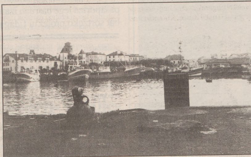
Donibane Lohizuneko portua.

Orokorki 31,2 milioi libera (561 milioi pezeta) inbertituko da eta azpimarra daiteke inbertsioaren kasik % 25 Europako Komunitatetik etorriko dela. Eraikitza lanak datorren udan hasiko dira pontoiekin eta saltokiarentzat. Maioristen zentrua eta tresneriaren tokiak beranduago bultzatuko dituzte.