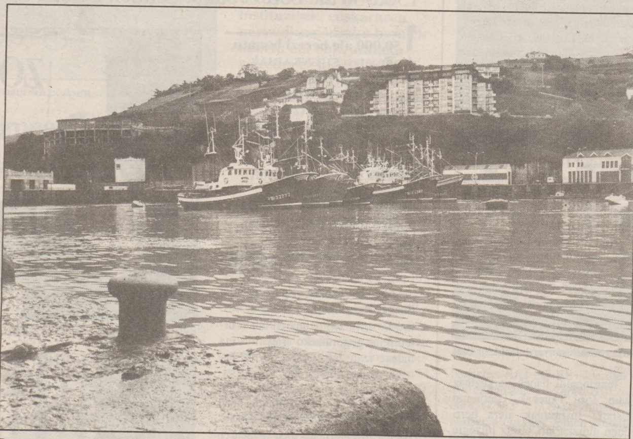
Bermeon 25 untxi eta Hondarribian 20 desagertu dira aurten baxurako flotaren birmoldaketaren ondorioz. MONTXO OTXOA

Espelek azpimarratzen duenez, Euskal Herriko baxurako untxien helburu nagusia hegaluzea izanik, arrantzuntziak arrain mota honen bankoak dauden tokietara bideratu behar dira. Gasteizko Gobernuak Arrantza sailburuak azaltzen duenez, «nere ustetan kaladeroak ez dira finkoak izango. Horregatik arrantzuntzi moldakor eta potentzia han-