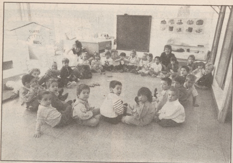
Ihardunaldietan 2 eta 6 urte bitarteko haurren hezkuntza aztertuko da A. BAYO