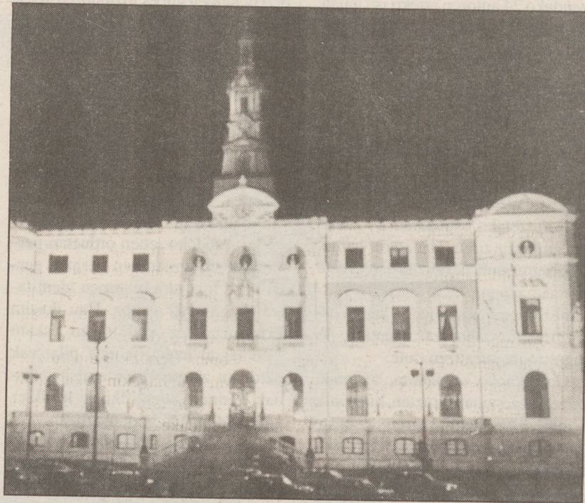
Bilboko Udalak agiri guztiak gaztelera hutsez plazaratzen ditu.

EHEkoek egindako neurketaren arabera, erabat euskaldunak diren