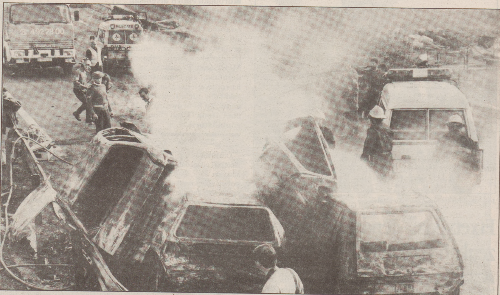
Kotxeek elkarren kontra jo eta autopistaren bi aldeetan geratu ziren.