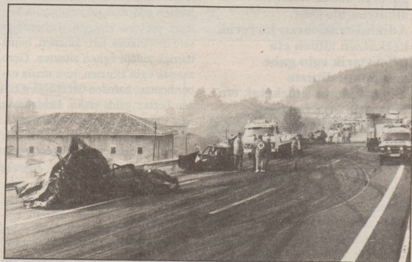
Istripua Erletxeondoan gertatu zen, Zornotzatik gertu.