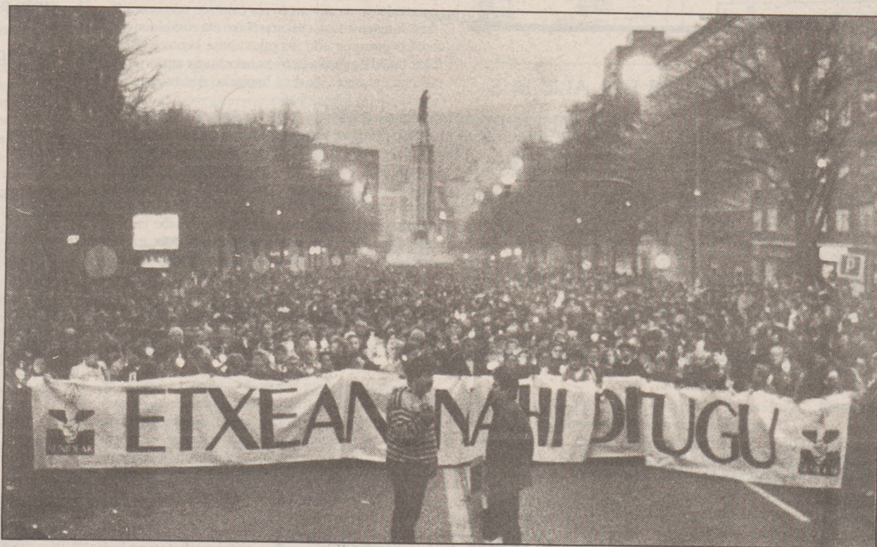
Senideak elkarteak beren familiakoen izenean eskertu zuen izandako «partaidetza handia».

Ardanzak «bake iraunkorra» ez duela nahi eritzi zion presoek seni-