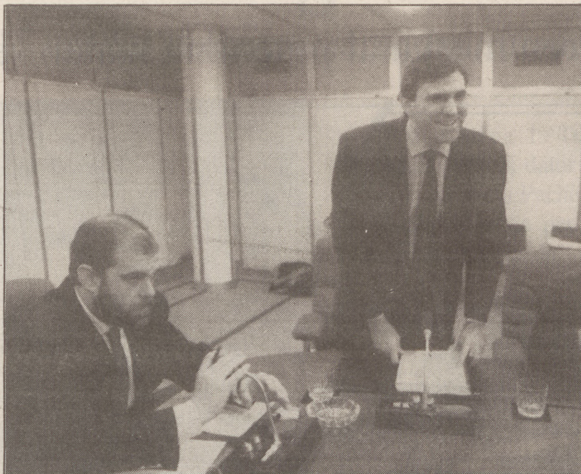
Japonian egindako gestioen berri eman zuen Azuak.

EUSKAL HERRIAREN BERRI Lehendakariordeak aipatu zuenez, Japoniarrek ez omen zeki-