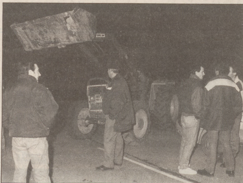
Nekazariak Boncolac lantegiaren sarrera blokeatuz.