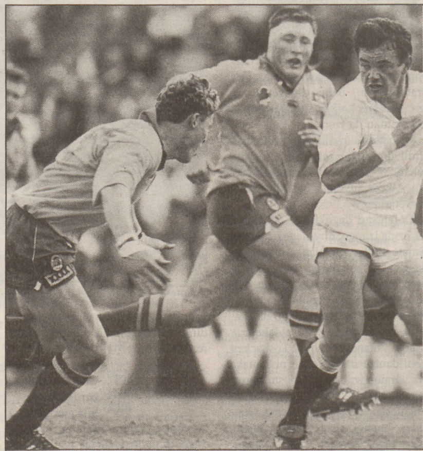
Inghaterrak ezin izan zioten australiarren presioari ihes egin.

✓ Inghaterrak Mundial osoan baino eskuko jokoa gehiago egin zuen finalean, baina ezin izan zuten australiarren defentsa gainditu, jokaldiak lotu eta arriskua sortu arren.