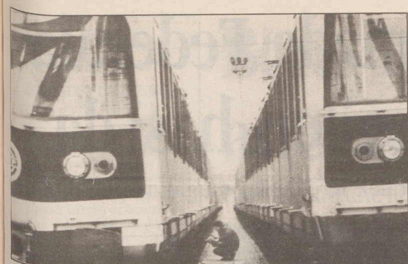
SNCFk Abiadura Handiko Trenaren hedapena mugatu behar izan du.