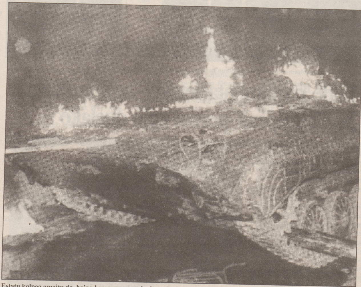
Estatu kolpea amaitu da, baina herenegun gaueko borroken aztarnek erakutsi dute zer gertatu den.

Boris Ieltsinek Moskuko hiritarrei dei egin zien Estatu Komitea osatzen zuten partaideei Estatu kolpeak porrot egin ondoren ihesi joaten ez uzteko. Berriak iritsi ziren Kriutxkov, KGBko buruzagiak limusina batean aldegin zuela maleta askorekin. Ordu batzuk beranduago Dimitri Iazov Defentsa ministroak bere burua hil