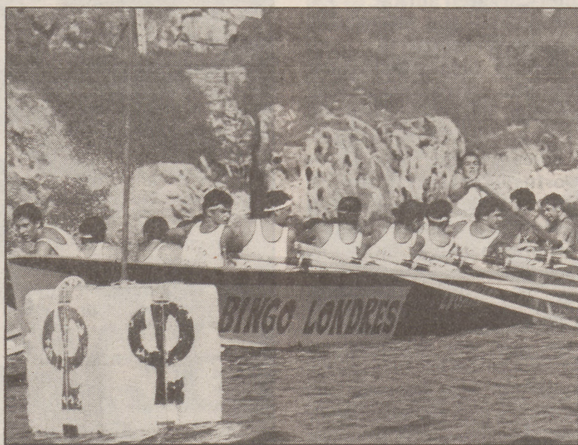
Lugañene traineruak ez luke garaipena lortzeko arazorik eduki behar. VILLAGRAN

Arerioak Ur-Kirolak eta Fortuna izango dira. Azkenak aurreko urteetako maila erakutsi duten bitartean, Ur-Kirolakekoek behera egin dute. Orain arteko estropadetan ikusi ahal izan dugunez, Loiolakoak oso urrutitatu daude lehen postuetatik. Lehengo urtean denboraldi polita burutu