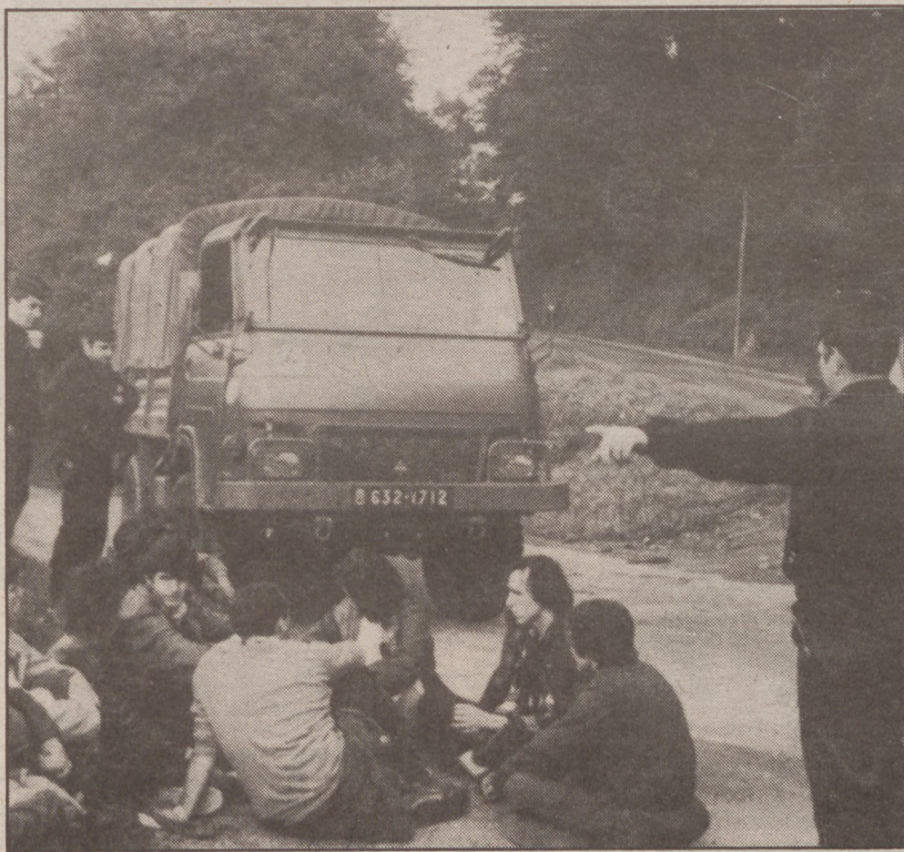
Armada frantziarraren kontrako mobilizazioak izan ziren Europa osoan.

MITTERRAND-EK PROIEKTUA DESEZTATU Frantziako Armada 3.000 hektareako lur eremu baten jabe zen Larzac-en bo-