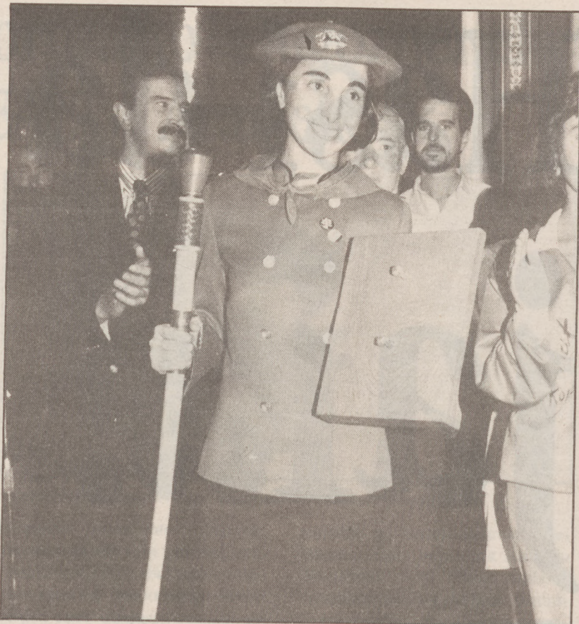
Hau Pittu Hau konpartsako ordezkaria da txupineroa.