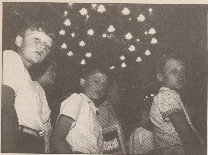
Soviet Batasuneko Briansk eskualdetik laurogei haur etorri dira. JOSE SIMAL