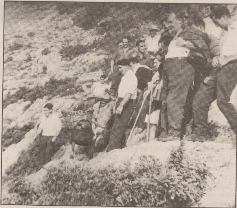
Aintzinako ohitura da erromeria hau egitea, argazkian orain 25 urte.

Aspaldi, hamaiketako egiteko eramaten zen pertza, nonbait, erori eta malda beheran joan zen, bere tripaki eta guzti. Hortik dator sinismen eta kondaira. Batzuren esanetan, bidea malkorra eta irristagarria zenez, Uharte Arakileraino erori zen pertza, txirinbuluka, eta baita bertako erritariari buruan jo ere, bidean bait zebilen, despistatu samartuta. Ondorioz, begioker gelditu omen zen gizarajoa. Beste batzuek diotenez, ordea, pertza bera zeramatenek eta astoak ere hartu zuten Uharteko bidea. Nola edo hala, gaur, goizeko seie-