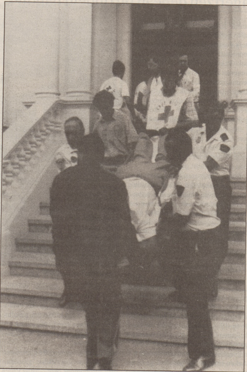
Logroñoko zaurituetakoa bat, Gobernu etxetik ospitalerantz eramatean. GRACIA legealdian bezala. Logroñoko udala, ostera, Partido Popularraren eskuetan dago.

La Riojako Gobernu autonomoa PSOEren eskuetan dago, baina oso gutxiatik. Maiatzaren 28ko hauteskunde autonomikoetan 16 diputatu lortu zituen PSOEek Legebiltzarran, 15 PPK eta bi Partido Riojano (PR) alderdi erregionalistak. PRk PSOErekin paktua egin du eta ziurtatu dute sozialistek agintea, aurreko