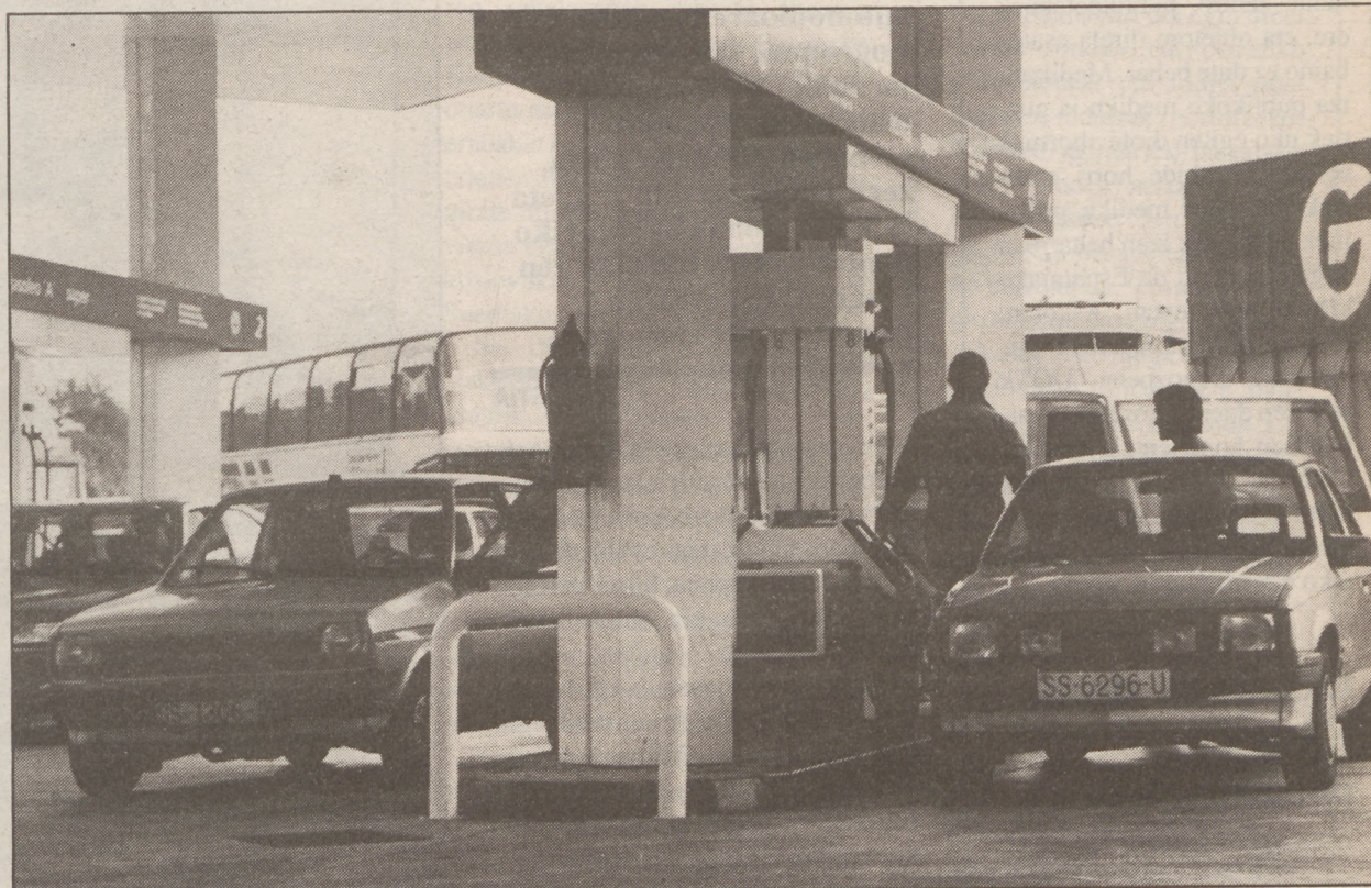
CAMPSaren gasolindegia gehienak Repsolen eskutara pasa dira monopolioaren bukaerarekin.

KONPETENTZIARI TRABAK JARRI Duela 65 urte-tik indarrean dagoen Monopolio legea eguneratzeko eta Merkatuaren liberalizazioa bazetorrela ikusirik, Estatuak araudi berria egin zuen 1988. urtean. Araudi horren helburua CAMPSaren eskutan ziren gasolindegia babesteko eta beste enpresen sorrera ahalbidetzea zen. Azken honetarako, gasolindegia sare paraleloa sortu zen, edozein hornitzailei erosteko askatasun teorikoa zeukaten gasolindegia pribatuentzako.