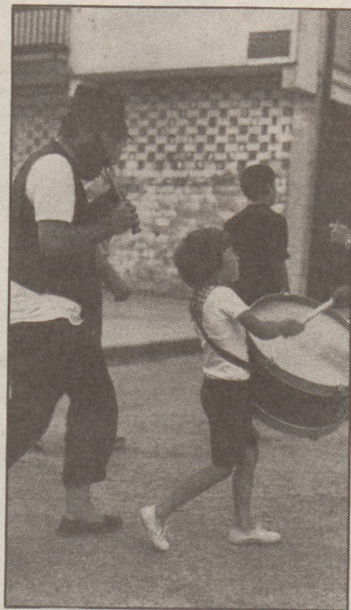
Gustu finenak asetzeko buruhausteak pairatu ondoren, inoiz egin ez diren jaiak antolatu dituzte arduradun sakrifikatuek.

Haurrentzako ekitaldiak behar beharrezkoak dira. Festa guztiak etxetik irten gabe pasatuz gero egongelan far west-eko gotorlekua eraiki edo erratzekin hockey partidua joka dezakete. Hobe dute buruhandiek txantxetan ibili eta etxeko altzairuak bakean uztea ●