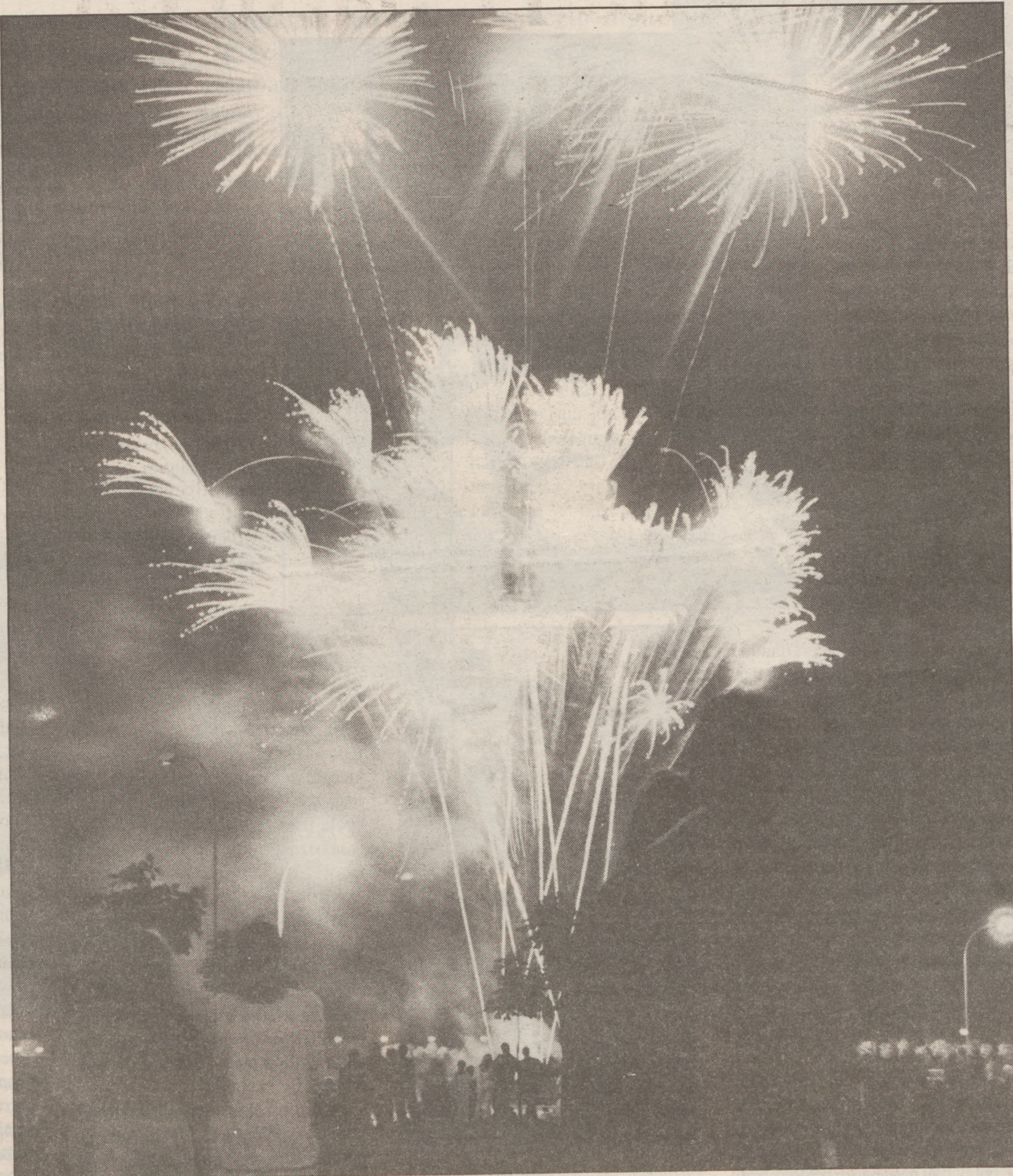
San Juan parkeak dituen abantailez ederki baliatu dira su festak aurretan.