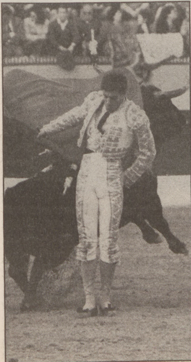
Litrik ez zuen jakin zezena hiltzen.

Arratsalde horretan ikusitakoak izan ziren baita ere toreatzaileen aldetikako gauzarik politenetarikoak. Zezenen mailarik ez zuten eman arren, bihankakoek —Emilio