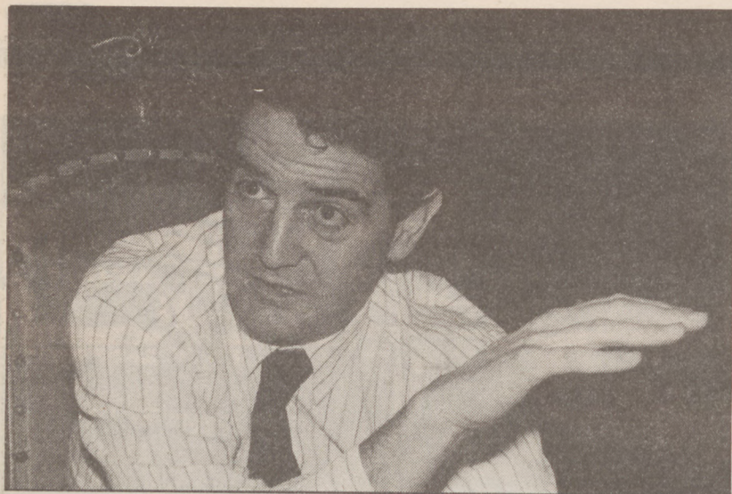
Gorordok EAJren Plentziako asanblada biltzea lortu du.