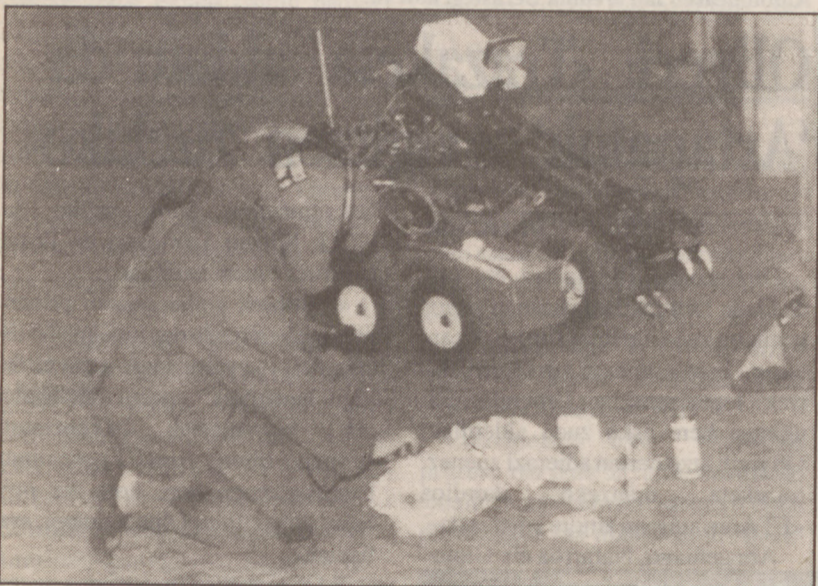
Polizi italiarrak lehegailua aztertzen du robot baten laguntzaz.

Gorordok Plentziako Asanbladari deitzeko eskakizuna egin zion herri horretako EAJko lehendakariari, beraren aurkako espediente zabaldua zegoela jakin zuenean, bazkideen aurrean defendatu ahal izateko. Bilboko alkate ohiak Arriola herriko epaile jeltzalearen jokabidea gaitzetsi zuen, espediente Herrialdeko Epaitegiaren esku laga baino lehena goberari abisua eman behar ziolako.