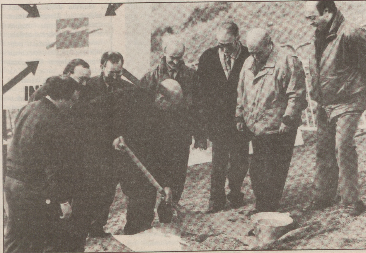
Joan den legegintzaldiko batzarkide taldeetako bozeramaleak lehen harria jarri zutenean.

Lurraldeko koordinakundeak gogoratu zuen atzo adostasunerako bi proposamena egin dizkiola Nafarroako Gobernuari, bata Irurtzun eta Lekunberri arteko zatiari buruz eta bestea Bi Ahizpetako pasabideari buruz.