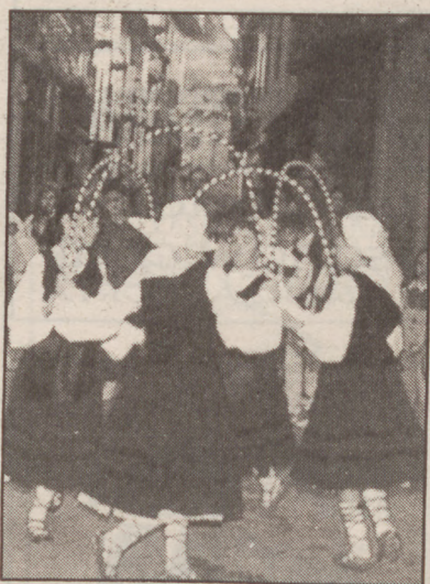
Dantzari txiki eguna da gaur.

Jaietako karrera hau antolatzen orain dela hamaika urte hasi zen Azpeitiko txirringululari elkarteak. Aurreko urteetan Azpeititik Zarautzera joan-etorria izan dute ibilbidea, baina horrelako probak antolatzeko trafikoa arazoak gero eta handiagoak dira eta, aurten aldatu egin dute ibilbidea ●