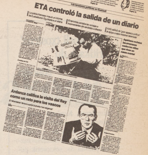
Bartzelonako 'El Periodico'.