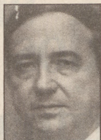
INAKI ANASAGASTI EAJko bozeramalea Kongresuan DEIA 1991-VII-27