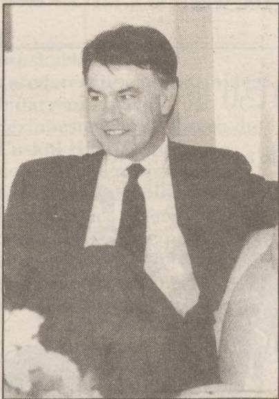
Felipe Gonzalezek deklaratu ahal izango du «Amedo» kasuan.