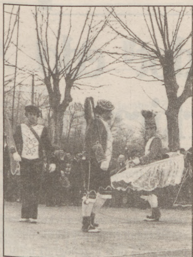
Segurrez Altzain izango da.