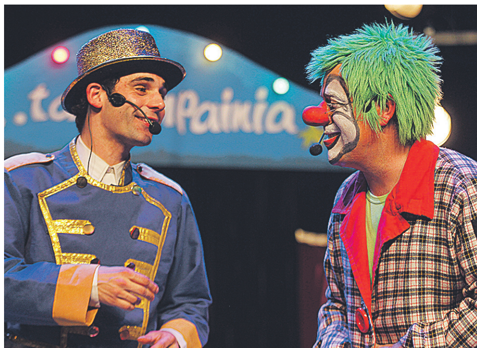
Poxpolo ta Konpainiak Tolosako Leidor antzokian eskainitako emanaldiko irudi bat. POXPOLO TA KONPAINIA

Ez, ez, badira betidanik ezağutzen ditugun abestiak ere. Diskorako abestiak sortzen ari ginela, haurrentzako hain ezağunak diren kanta batzuk sartzea beharrezkoa ikusi genuen: Alferraren astea eta Markoxen txarrix , kasu. Hala, sortu berri genituen abestiekin batera, beste hainbat herri kanta txertatzea erabaki genuen. Orotara, beraz, sekula entzun gabeko sei abesti berri daude, eta gainerako bostak Euskal Herriko herri kanten bertsiok dira. Ikusleek abesti berriak gustura hartzen dituzte, baina den-denak berriak izatea ere ez dute nahi izaten. Beraz, nahasketa bat egitea erabaki genuen.