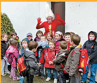
Klubeko pertsonaiekin egoten dira bisitariak.

Eskaintza oparoa eta zabala dute lagun talde, familia, ikastetxe zein elkar-teentzat. Asteazken zehar bi edo hiru eguneko egónaldiak egiteko aukera dute ikastetxe eta elkar-teek. Zerainean dauden egunetan, hainbat gai lantzen dituzte lagun taldeek, jardueren bi-