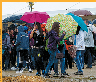
Nafarroa Oinez festa ilundu zuen euriak.

Joan den igandean, kolorea eta irria zabaltzeko asmoa zuen Irrien Lagunak klubak, San Fermin ikastolak Zizur Txikian antolatu zuen Nafarroa Oinez jaietan. Euskaraz ikasteko eta bizi-